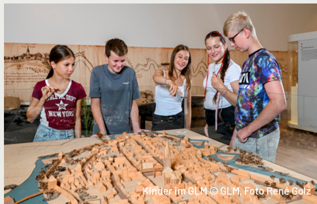
Kinder im GLM

Mit diesem Schritt reagiert das Museum auf vielfach kommunizierte sowie aktuelle Bedürfnisse von Familien und unterstützt zugleich die städtische Strategie „Hamm – auf dem Weg zur familienfreundlichsten Stadt“. Familien finden niedrigschwellige Angebote, erleben das Museum als offenen Ort für ihre Freizeitgestaltung. So verstehen das Gustav-Lübcke-Museum und die Stadt Hamm Familie bewusst vielfältig – als Menschen, die füreinander da sind und Zeit miteinander verbringen möchten. Der Hammer Museumstag für Familien leistet damit einen konkreten Beitrag zu einer Stadt, in der sich Familien willkommen fühlen und Kultur gemeinsam entdecken können. Das neue kostenfreie Format richtet sich an Familien mit Kindern unterschiedlichen Alters. Ein entspannter Museumsnachmittag, bei dem Lernen, Zuhören und Selbermachen im Mittelpunkt stehen. Typischer Weise beginnt ein Hammer Museumstag um 14.00 Uhr mit einer öffentlichen Familienführung durch eine ausgewählte Sonderausstellung und bietet ab 15.00 Uhr Kreativaktionen oder Kurzlesungen mitten in der Ausstellung. Die Kurzlesungen finden in Kooperation mit der Lesewelt Hamm statt. Die nächsten Hammer